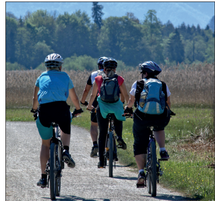
Radfahren für das Klima – und für das Dorf. Jeder Kilometer zählt!

Aber wo es Ranglisten gibt, gibt es ja auch den Ehrgeiz, vorne zu landen.